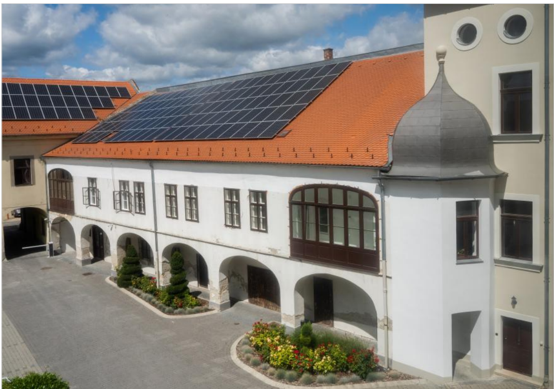
Mosonmagyaróvári Városvédő Egyesület