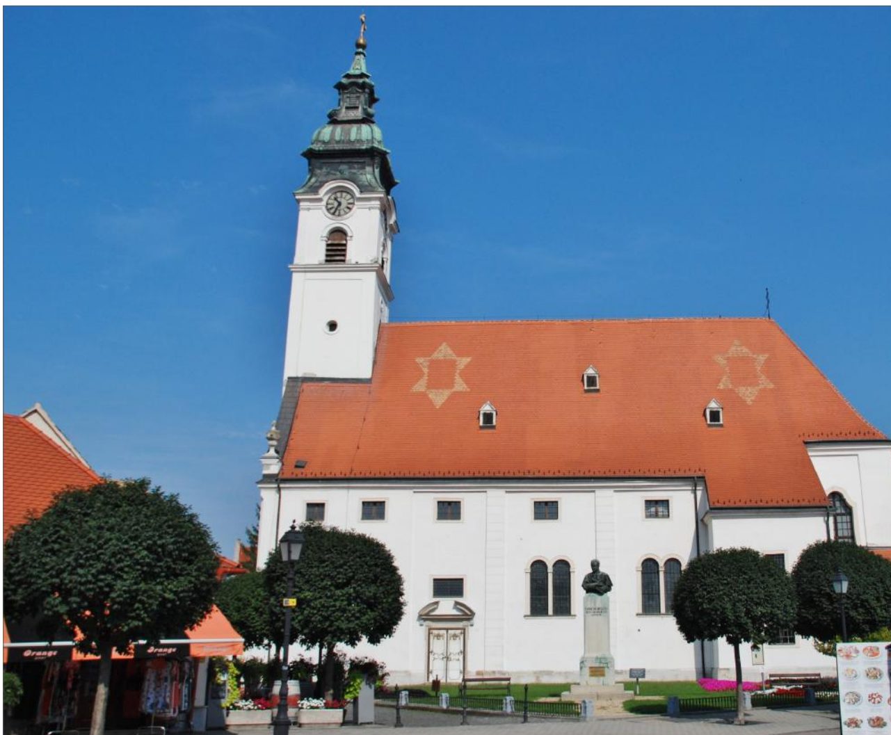
Mosonmagyaróvári Városvédő Egyesület